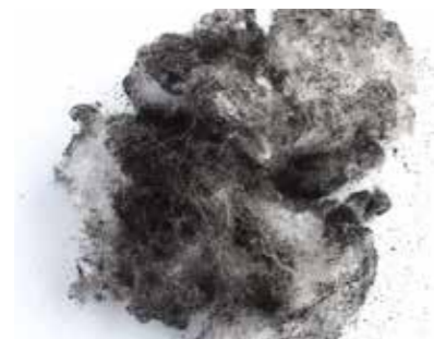
Bild 1: Ablagerungen im Schüttgut, die sich in Schalldämpfern mit Absorptionsmaterial sammeln

Die Aerzener Maschinenfabrik GmbH leistet mit dieser Zertifizierung für alle ausgelieferten Maschinen (Delta Blower, Delta Hybrid, Delta Screw) seit Jahrzehnten einen wichtigen Beitrag zur qualitativ hochwertigen Absicherung der ölfreien Betriebsluft, die zur Druckluftherzeugung für die verschiedensten Prozesse und Anwendungen in den o. g. Industrien eingesetzt wird.