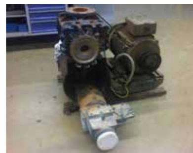
Bild 3: Aufgebrannte Druckluftanlage nach Funkenerzeugung in der Gebläsestufe