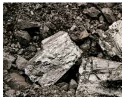
Bild 2: Mit Öl kontaminiertes Schüttgut aus dem pneumatischen Förderprozess