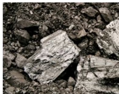
Bild 2: Mit Öl kontaminiertes Schüttgut aus dem pneumatischen Förderprozess