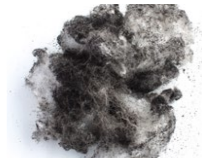
Bild 1: Ablagerungen im Schüttgut, die sich in Schalldämpfern mit Absorptionsmaterial sammeln

Die Aerzener Maschinenfabrik GmbH leistet mit dieser Zertifizierung für alle weltweit installierten Maschinen (Delta Blower, Delta Hybrid, Delta Screw) seit Jahrzehnten einen wichtigen Beitrag zur qualitativ hochwertigen Absicherung der ölfreien Druckluft, die für die verschiedensten Prozesse und Anwendungen in den o. g. Industrien eingesetzt wird.