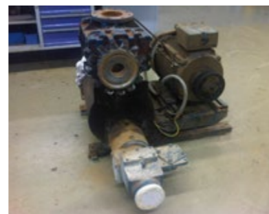
Bild 3: Aufgebrannte Druckluftanlage nach Funkenerzeugung in der Gebläsestufe